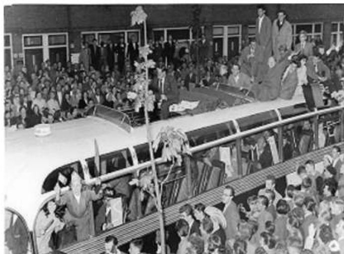
Kampioenstocht met bus door de Scheveningse straten