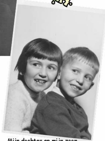
Mijn dochter en mijn zoon