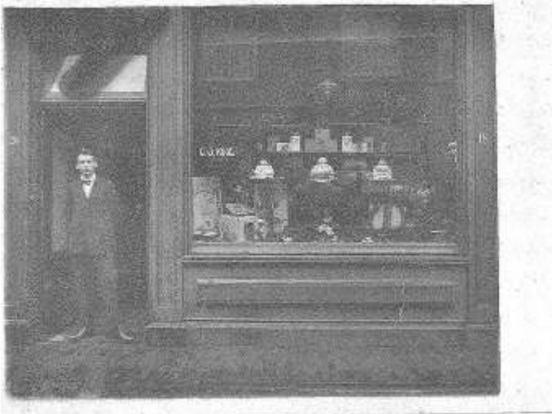
Op deze foto staat mijn vader voor zijn winkel.

Mijn vader had 'n brood en banket bakkerij en bij dat winkelpand hoorde ook 'n woonhuis dat was verhuurd.