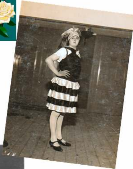
Mijn moeder in haar dansjurk.