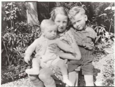
Mijn broertje, mijn zusje en ik.