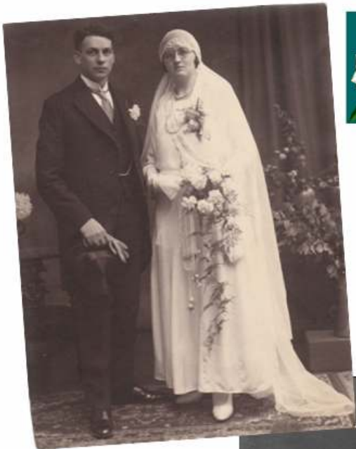
De trouwfoto van mijn vader en moeder.