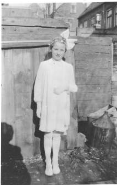
Hier sta ik dan met mijn mooie jurk bij ons achter in de tuin. Ik deed mijn eerste communie.

Ik denk dat dit de reden is waarom ik het daar best naar mijn zin heb gehad.