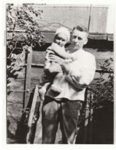
Op vaders schouders.