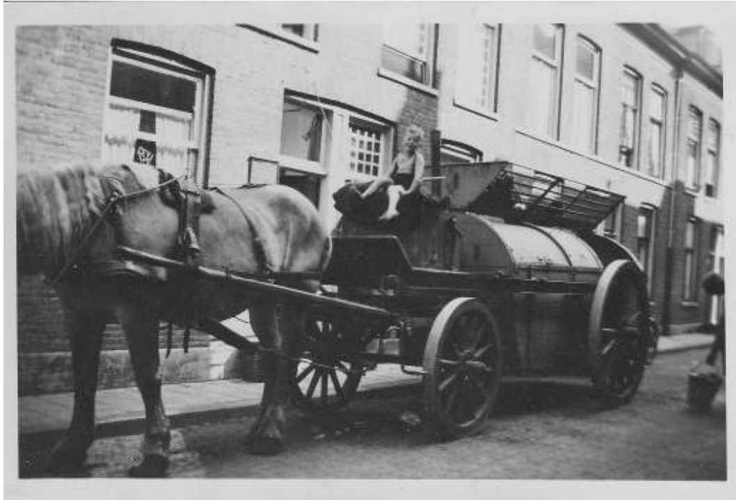
Mijn broer op de vuilniswagen, omstreeks 1940

Mijn broer leeft nog en woont tegenwoordig op Bonaire.